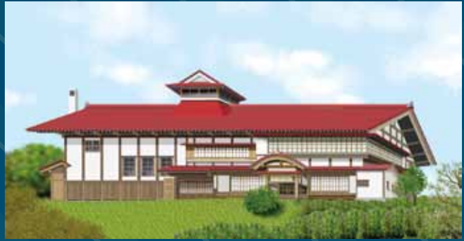
小樽市鎌御殿 イラスト・中村幸一