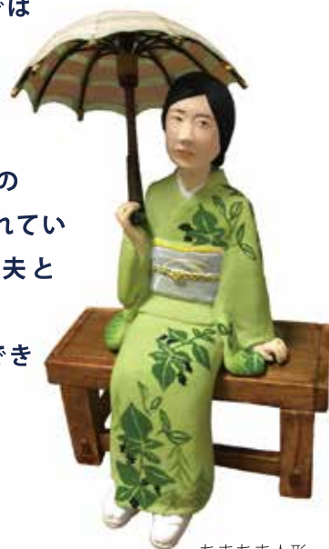
ちまちま人形 (大野百合子展) 制作：高山美香

影に隠れてしまう仕事にスポットライトを当て、普段は目にできない文学館展示の「裏側」をご紹介します。