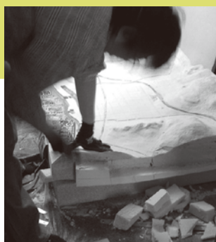
模型制作：田中まり