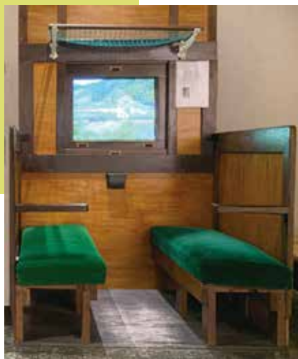
伊藤整の通学列車(若い詩人の肖像展) 制作：渡辺真吾