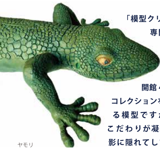
ヤモリ (小樽・札幌喫茶店物語展)