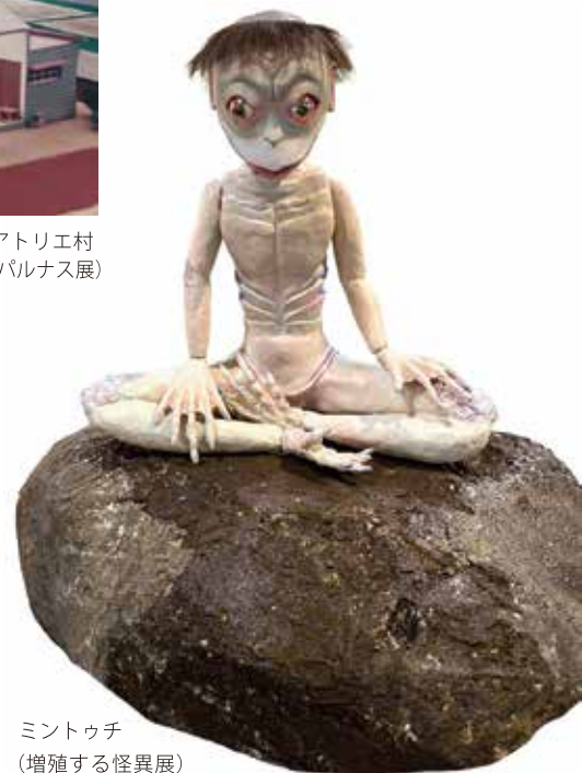
ミントウチ (増殖する怪異展)